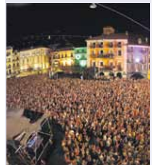
Moon & Stars