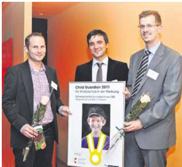
Jonas Steiger, Contexta, Rocco R. Maglio, Stiftung Terre des hommes, Reto Meissner, SBB.